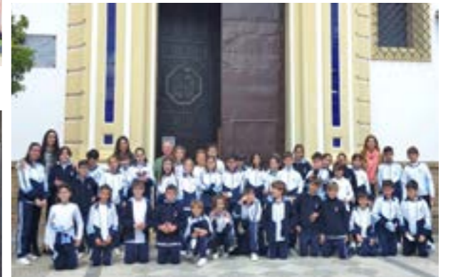
En Cuaresma nos visitó el colegio de Santa Isabel