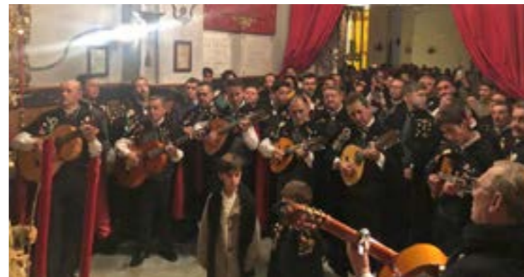
El 25 de diciembre el coro de la Jumozá visitó nuestro Belén