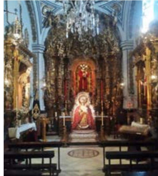
Lugar ocupado por la patrona de San Miguel mientras el interior y exterior de su capilla eran remodelados