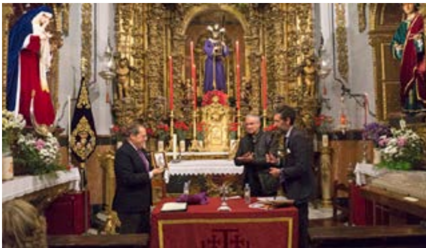
Calurosa despedida al ponente al que se le hace entrega de la imagen del Señor