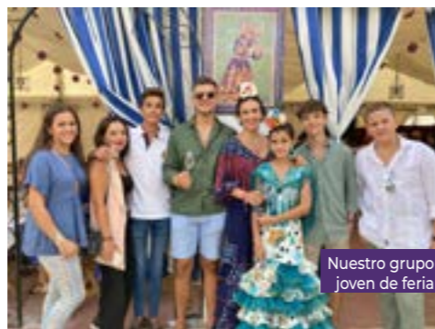
Nuestro grupo joven de feria