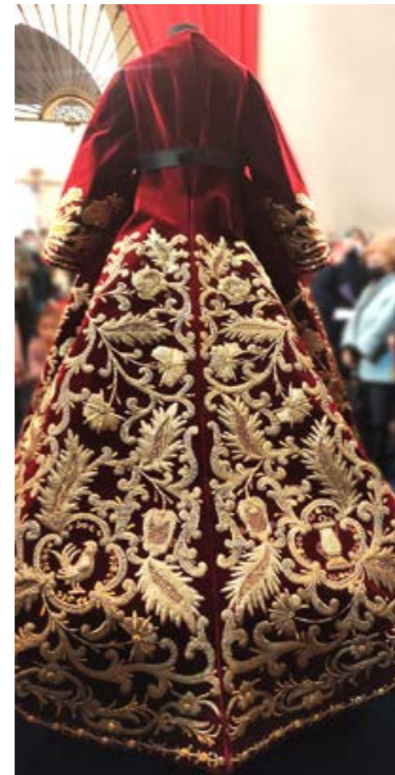
Detalles de la túnica después de su intervención por parte de los restauradores