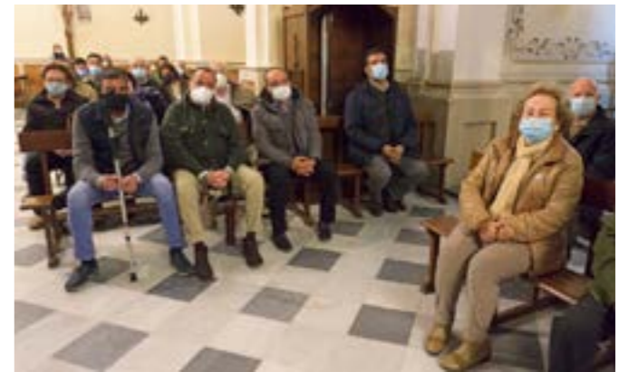
Auditorio en una de las sesiones de los viernes de cuaresma, celebrada en la capilla Sacramental de la Hermandad