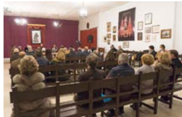
Auditorio de casa hermandad de calle Sevilla