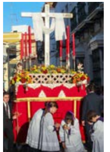
Mayo y la cruz nazarena