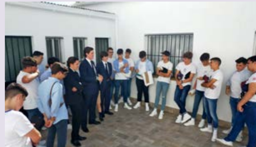
Cuadrilla Cruz de mayo, 2022