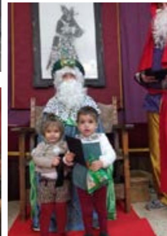
Los más pequeños visitan, el día de San Juan, al Cartero Real de los Reyes Magos