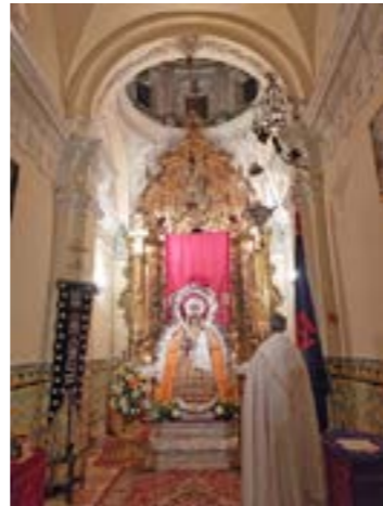
Nuestra Señora, Virgen de los Remedios en Solemne Besamanos, recibe en la Candelaria a los bebés de la Parroquia