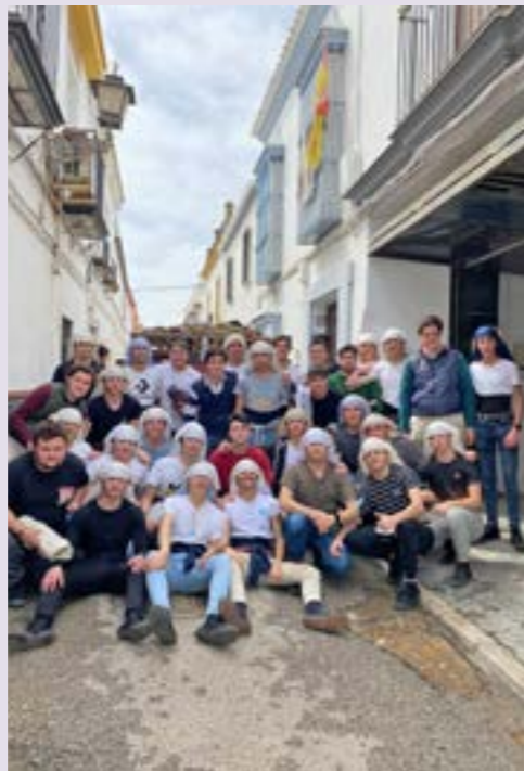
Cuadrilla del paso de San Juan, Semana Santa 2022

Costalero es andar juntos los dos, por el mismo derrotero. Yo debajo, y arriba Él. Desde tiempos pretéritos la presencia del cargador humaniza el ritual de la anual conmemoración primaveral de la Pasión, Muerte y Resurrección de Nuestro Señor Jesucristo en nuestra querida tierra. El trabajo de estos simbólicos atlas debajo de las parihuelas de los pasos, ayuda a acercar el mensaje de la Iglesia al pueblo devoto y fiel. Los hombres de Dios y María se convierten bajo las trabajaderas en improvisado nexo de unión entre lo divino y lo humano. Santeros, costaleros, hermanos o aficionados, todos fortalecen con su proximidad el credo de la gente en un singular contexto, en el que el peso de la tradición determina la estética de nuestra religiosidad popular. El costalero de siglo XXI igual que