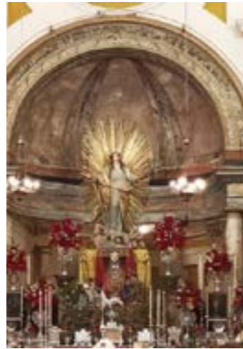
Visita a la Parroquia de María Magdalena, Arahal, en el año Jubilar