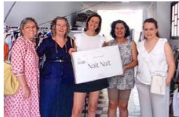
Colaboración con grupo de refugiados en Fuentes de Andalucía

De empresas, comercios, farmacias, particulares, ... que se han implicado e implican en nuestro compromiso por Ucrania.