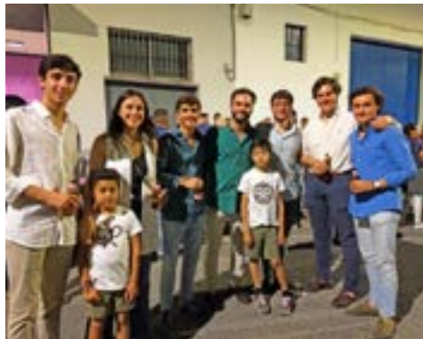
Miembros del grupo joven