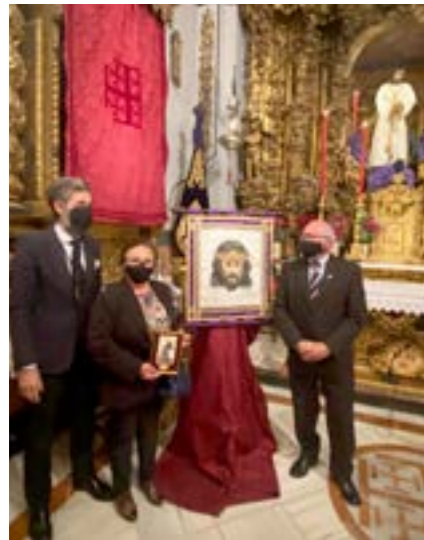
Familia Calle Pliego