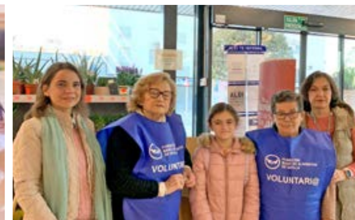
Voluntarias en la recogida de alimentos de diputación de Caridad

material a la comunidad de Fuentes, hemos sido un canal transmisor. Ajena al presupuesto de la Hermandad y fruto de la ayuda de empresas, comercios, farmacias y particulares con las que desde caridad , se ha contactado y que no han dudado en colaborar. Esta línea de ayuda permanece actualmente abierta.