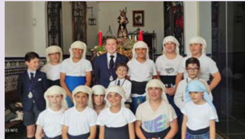
Cuadrilla del altarito de Nuestro Padre Jesús Nazareno, 2022

Aunque algunos no lo crean, los pasos pesan, y la devoción y la tradición familiar no los traen de vuelta s San Miguel, a los pasos los trae de vuelta la fortaleza del grupo