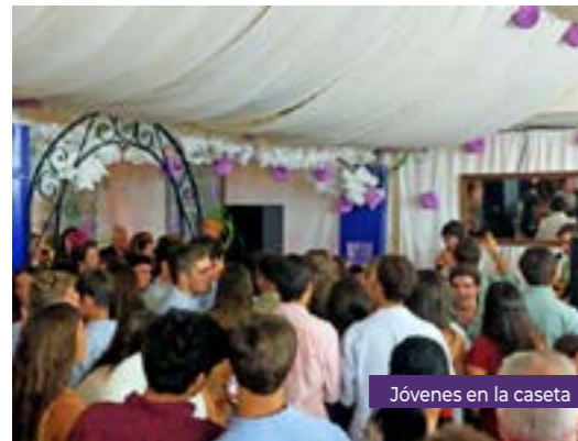
Jóvenes en la caseta