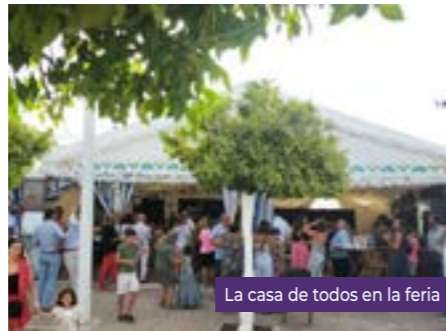
La casa de todos en la feria