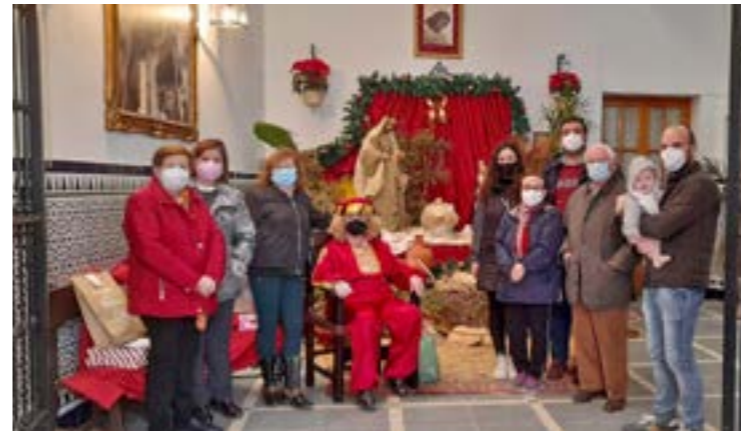
Entrega de regalos de Reyes Magos a los menores de la parroquia