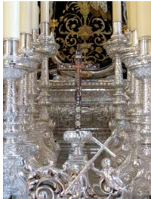
Detalle de la Cruz en la delantera del palio de María Santísima