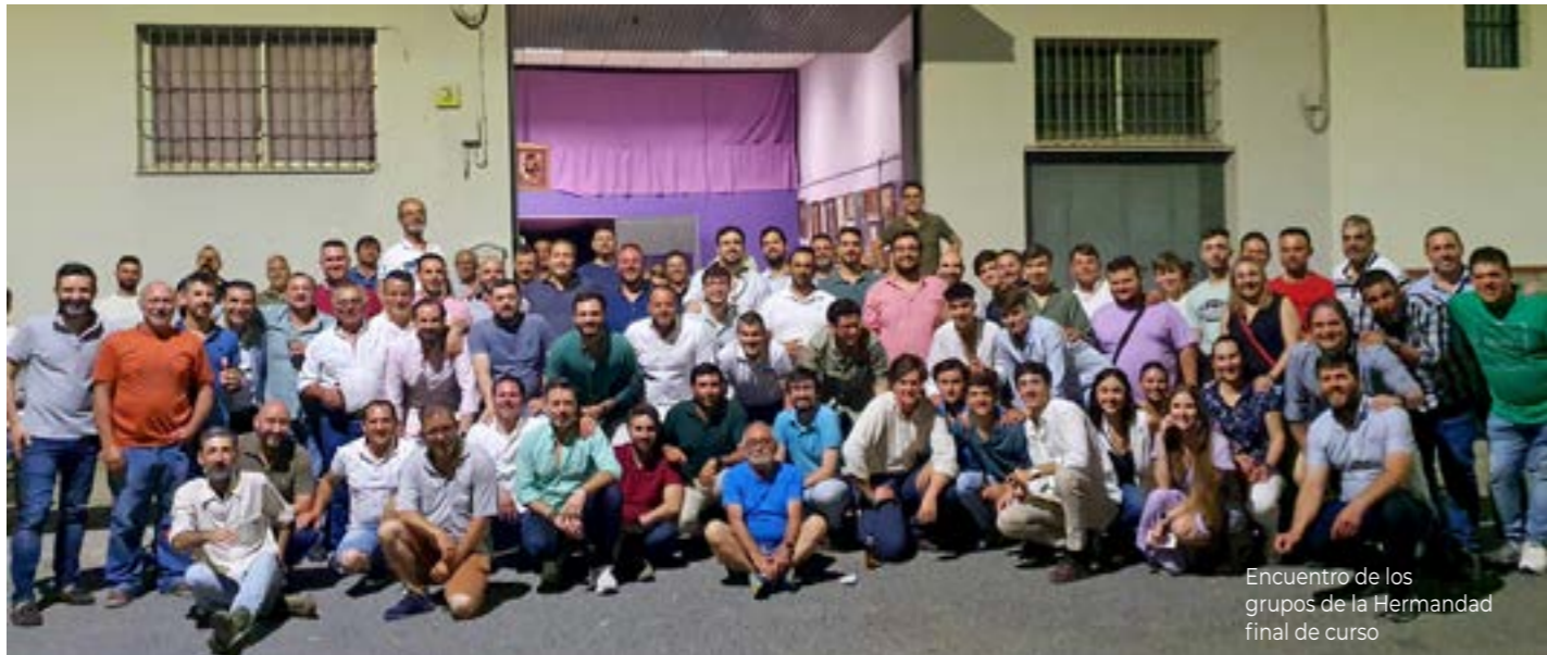
Encuentro de los grupos de la Hermandad final de curso