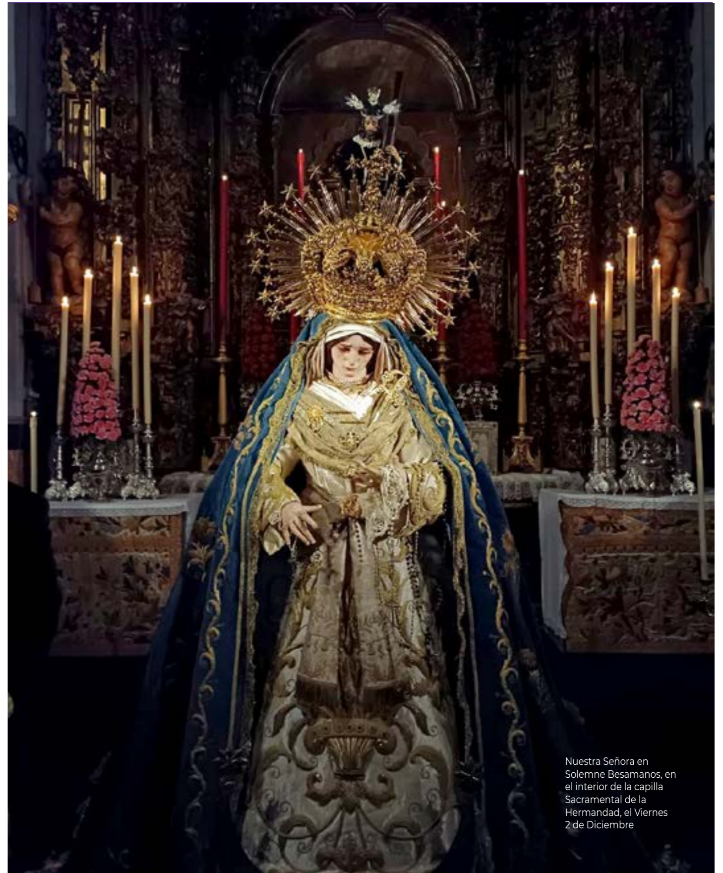
Nuestra Señora en Solemne Besamanos, en el interior de la capilla Sacramental de la Hermandad, el Viernes 2 de Diciembre