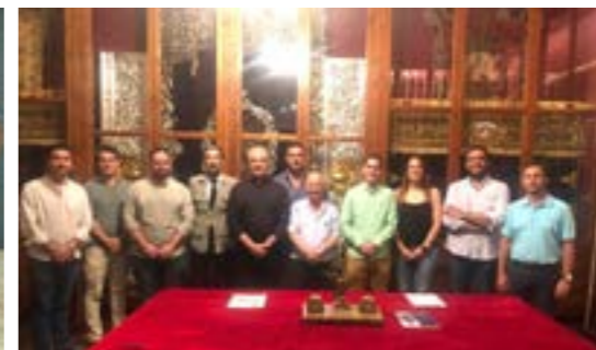
El Carmen de Villalba, nueva banda que procesionará tras el palio de nuestra madre, María Stma. de las Lágrimas