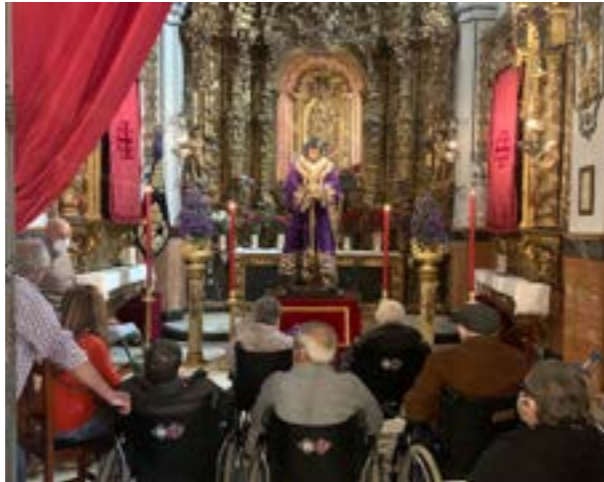
Martes Santo nos visitan las Residencias de Marchena