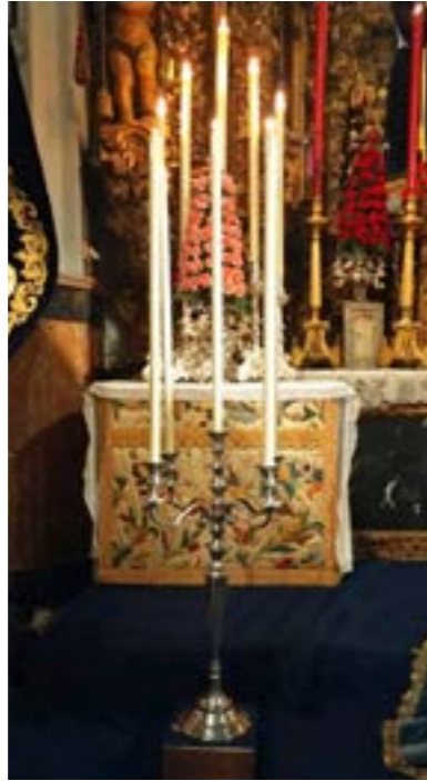
Nuevos candelabros de plata

Un juego de dos candelabros de plata del principios de s XX, formará parte del acervo patrimonial de la Hermandad para exorno y luz de los altares de culto.