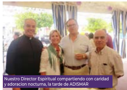
Nuestro Director Espiritual compartiendo con caridad y adoracion nocturna, la tarde de ADISMAR