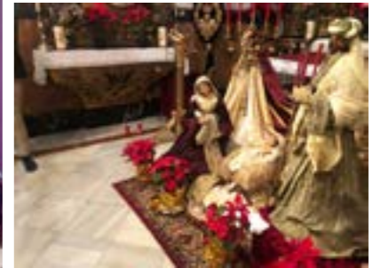
Belén nazareno en la Capilla Sacramental