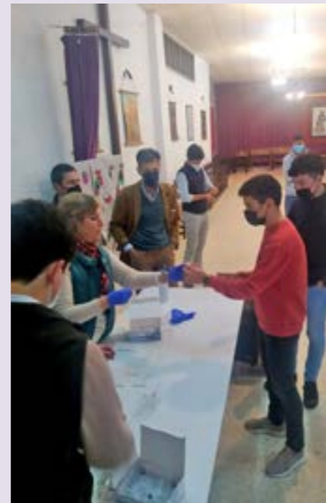
Haciendo prueba COVID antes de los ensayos, 2022

el santero del siglo XIX, se convierte en propicia herramienta pedagógica al servicio de la teología de Roma. La esencia de Trento sigue muy presente en nuestra Semana Santa, porque nadie mejor que nosotros, sabe interpretar el concepto de “sacar a la Iglesia Triunfante a la calle”. Pero que no se nos olvide una cosa muy importante, el de cargador ante todo es un oficio con todo lo que ello conlleva. De ahí que el trabajo que realizan nuestros cos-