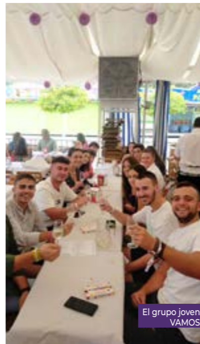
El grupo joven VAMOS