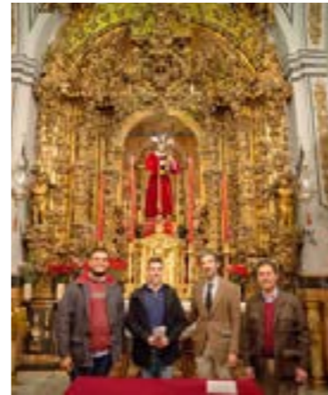
Con la capilla musical Ars Sacra