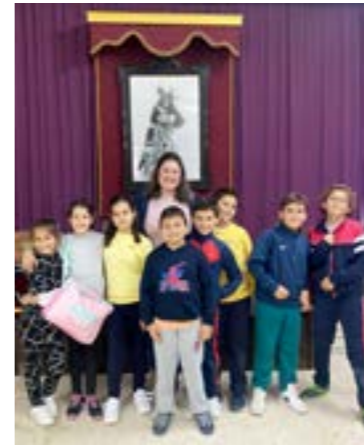
La Hermandad con los grupos parroquiales de catequesis