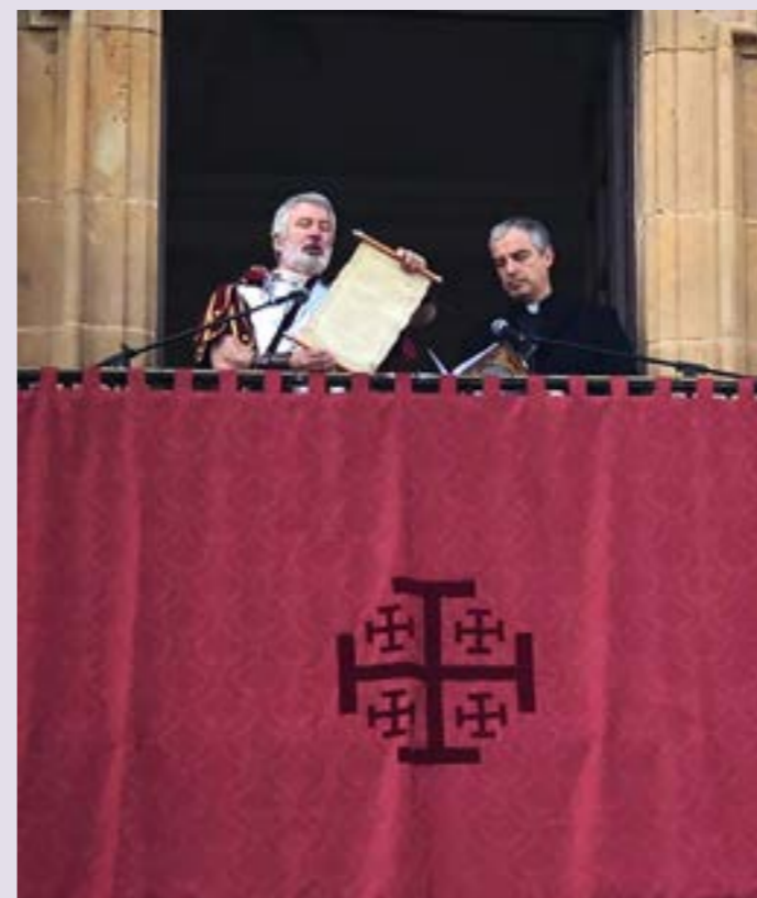
Desde el "púlpito" de la casa consistorial de la plaza ducal, el jefe de escuadra pronuncia Sentencia

Por eso, el hacer nuestra estación de penitencia como miembro de la centuria romana de nuestro padre Jesús Nazareno de Marchena, es un gran honor personal, y un motivo de satisfacción dentro del mundo cofrade marchenero.