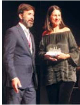
Reconocimiento a la Hermandad por su participación en la ayuda contra el COVID