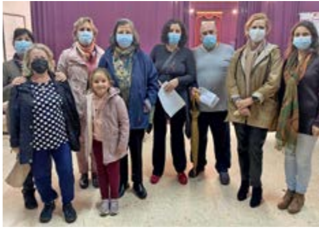
Voluntarios que participaron en el acto de donación de sangre organizada por la Hermandad

De todos los grupos de Nuestra Hermandad donde he encontrado respuesta y cariño.