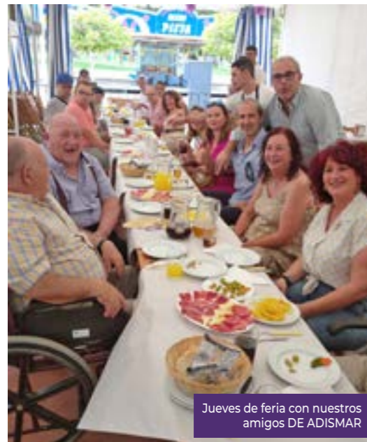
Jueves de feria con nuestros amigos DE ADISMAR