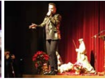
Concierto Benéfico, en el auditorio Pepe Marchena, el día 16 de Diciembre. Un verdadero éxito de organización y afluencia de asistentes