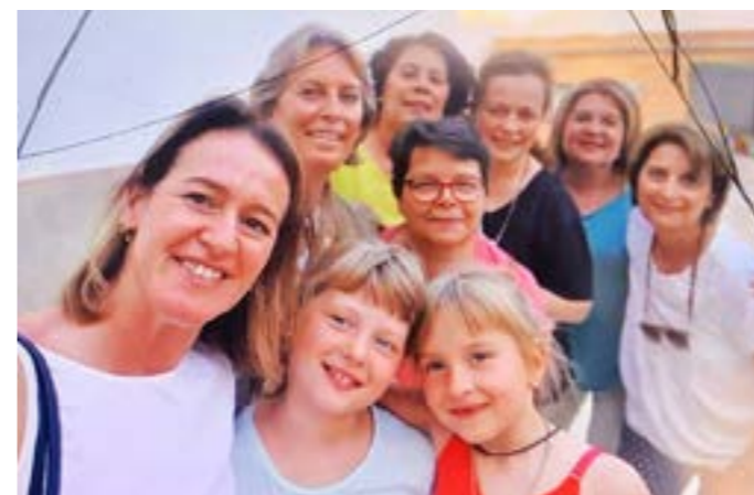
Colaboración con la comunidad de acogida de refugiados ucranianos en Fuentes de Andalucía