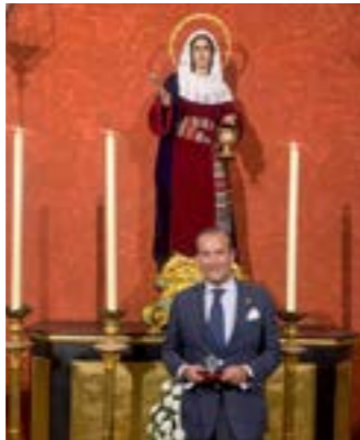
Reconocimiento a la Hermandad por su participación en la Huchas Solidarias de la Hermandad de Santa Marta