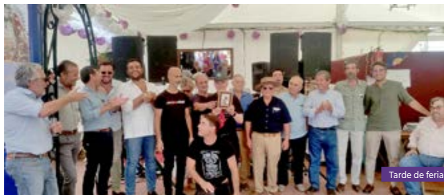
Tarde de feria