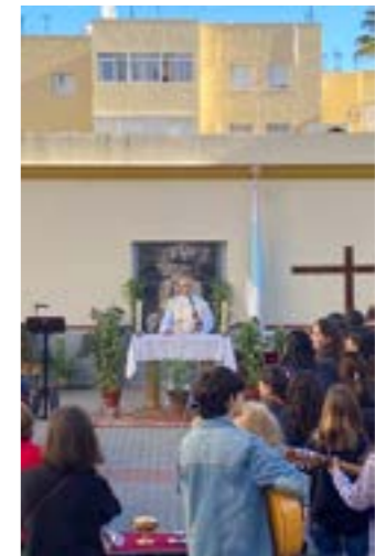
Tras el saludo, lo más jóvenes cantaron a la Virgen en Vía Lucis, hasta llegar a Ciudad Jardín portando la cruz de el Señor, donde se celebraría la Sagrada Eucaristía oficiada por don Daniel, para a continuación NHª Ana Cristina compartir un sentido testimonio de fe. La convivencia se extendió con almuerzo en casa hermandad