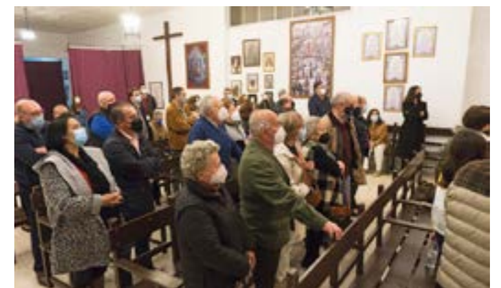
Público de cofrades la noche de la charla de último día del ciclo