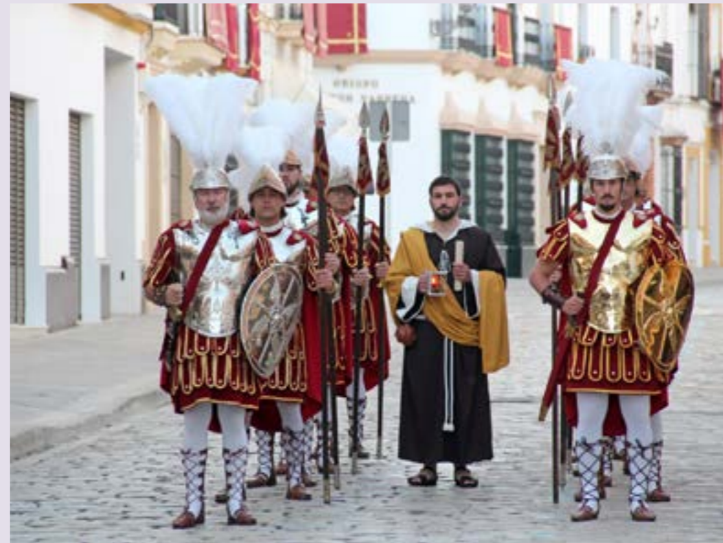
Judas aguarda en calle Santa Clara el momento de prender al Señor

En esa representación, nuestra centuria romana toma cierto protagonismo en diferentes momentos, como son: