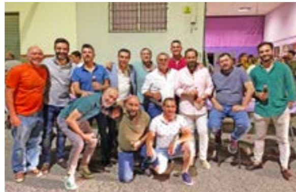
Miembros del cuerpo de la Hermandad