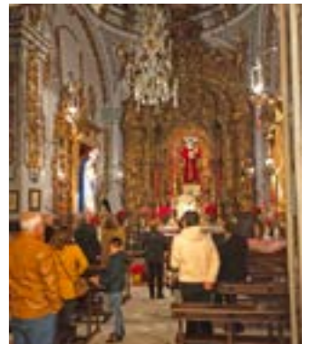
Misa del Gallo