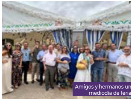
Amigos y hermanos un mediodía de feria